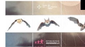
Sonderpostzeichen einheimischer Fledermäuse

Eine Zertifizierung der Veranstaltung mit Fortbildungspunkten wurde beantragt