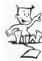
KfH-Nierenzentrum für Kinder und Jugendliche Marburg